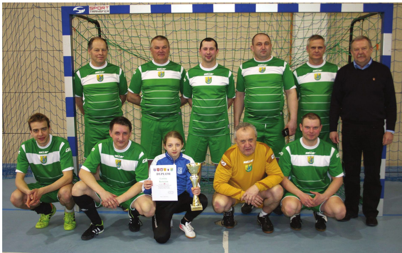
Drużyna Gminy Kościan zaprezentowała się w nowych strojach

nałach. Rozgrywki odbywały się w dobrej, przyjaznej atmosferze, a rywalizacja sportowa widoczna była do ostatniego gwizdka sędziego. Po emocjonujących i ciekawych meczach zwycięstwo wywalczyła po raz piąty drużyna reprezentująca Powiat Kościański. Drugie miejsce przypadło ekipie Miasta i Gminy Krzywiń, a na trzecim miejscu uplasowała się Gmina Kościan. Kolejne miejsca przypadły Gminie Śmigiel i Gminie Czempin oraz reprezentacji Miasta Kościana. Organizatorem turnieju był Ośrodek Sportu i Rekreacji w Kościanie, a puchary dla wszystkich drużyn oraz poczęstunek ufundowano ze środków Gminy Kościan. (md)