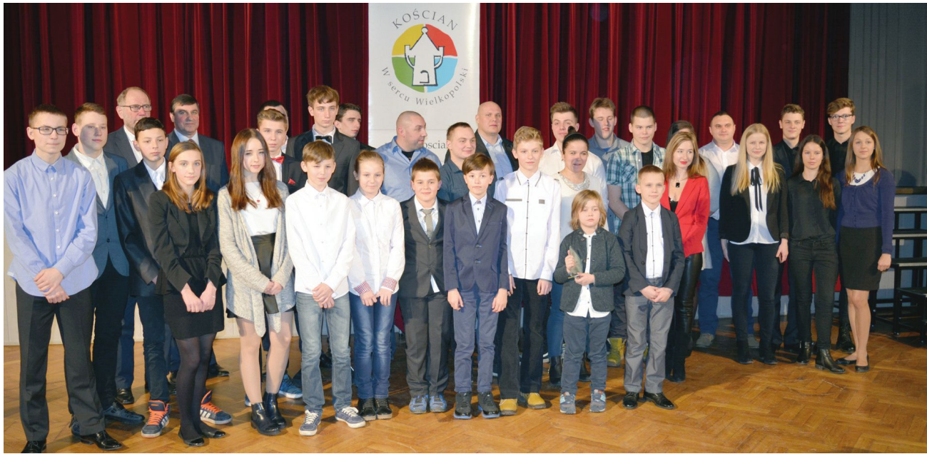
Samorząd Kościana podziękował zawodnikom i trenerom za ich osiągnięcia sportowe