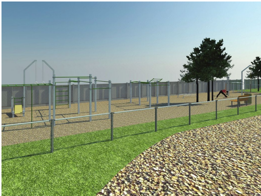
Projektowany plac rekreacyjny w Racocie