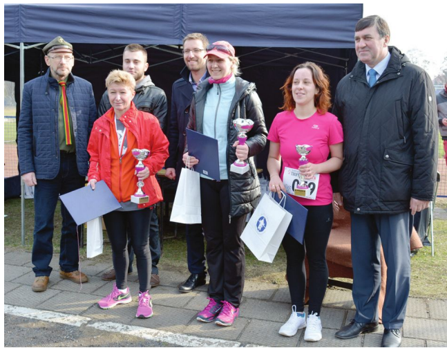
Ideą biegu było uhonorowanie Pamięci Żołnierzy Wyklętych oraz popularyzacja biegania