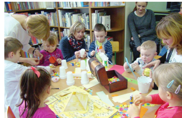
W przedszkolach i szkołach dzieci i ich rodzice mogli zapoznać się z ofertą placówek i uczestniczyć w przygotowanych zajęciach

W sobotę 5 marca br. w kościańskich placówkach oświatowych odbyły się Drzwi Otwarte. Była to doskonała okazja do tego, aby rodzice, jak i dzieci mogły lepiej poznać przedszkola, czy szkoły. Podczas takich dni, oprócz zwiedzania obiektów, prezentowana była oferta edukacyjna oraz zajęcia dodatkowe prowadzone przez placówki. Rodzice mogli poznać nauczycieli i zapytać o wszelkie nurtujące ich sprawy. Dzieci brały udział w różnych zajęciach, grach i zabawach przygotowanych przez nauczycieli. Takie zajęcia dały możliwość kandydatom poznania swoich rówieśników, z którymi już od września będą spędzać więcej czasu.