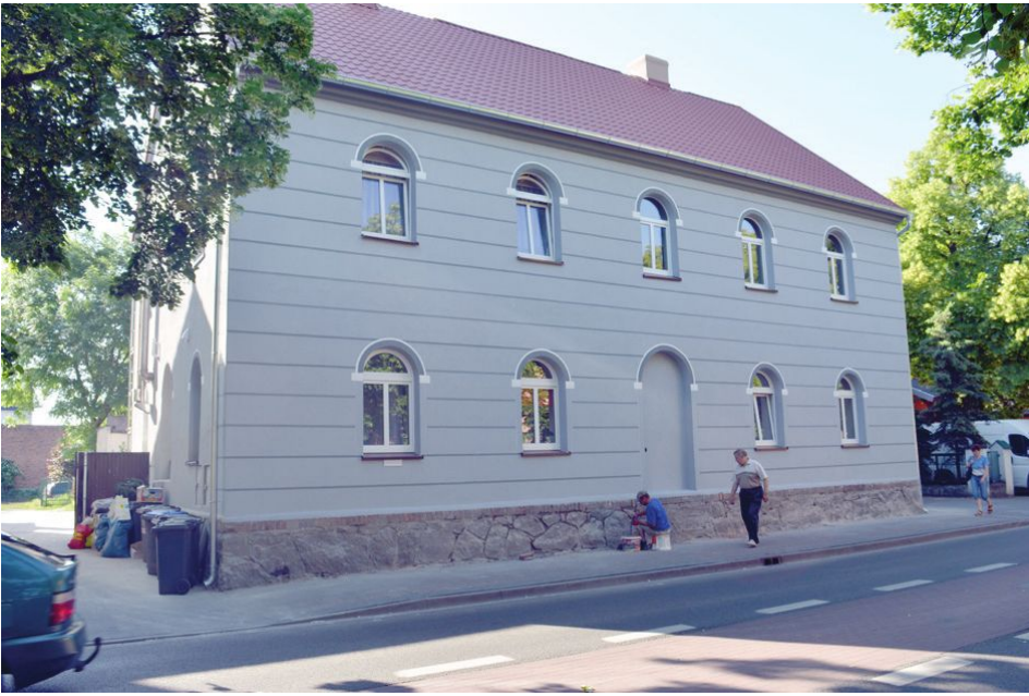
Nowy wygląd budynku – al. Kościuszki 25