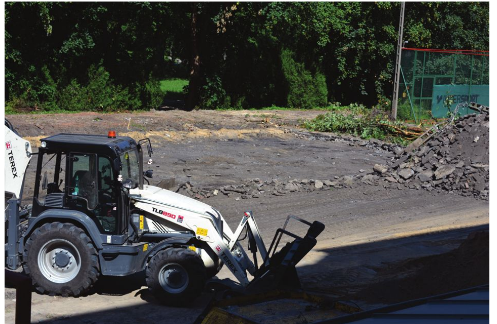
Budowa kanalizacji deszczowej na terenie ILO