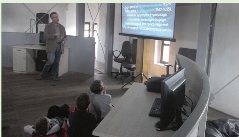
O gdańskim astronomie w kościańskim obserwatorium astronomicznym