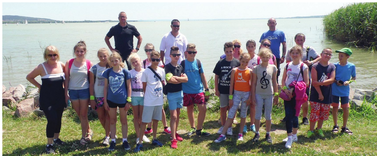
Obozowicze nad Balatonem

mie lipca i sierpnia zostanie rozebrany przepust ceglany w ulicy Wodnej w Racocie. Przebudowa potrwa do września 2016 r. Sugerujemy dojazd do posesji przez Darnowo. Za powstałe utrudnienia serdecznie przepraszamy.