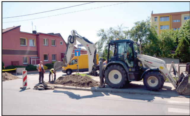
Rozpoczęły się prace remontowe na ulicy Wielichowskiej. Koszt inwestycji realizowanej wspólnie samorządem miasta to ponad 1 mln 600 tys. złotych.