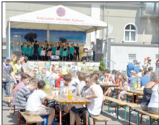
Dla uczestników XIII Dnia Godności wystąpił chór Muza z ZS nr 3 w Kościanie.

Orędownik Samorządowy. Pismo informacyjne. Redagują Starostwo Powiatowe w Kościanie, Urząd Miejski w Kościanie, Urząd Gminy w Kościanie. Redaktor naczelna - Jolanta Napierała. Wydawnictwo AGA w Kościanie, ul. Wrocławska 6. Druk: Drukarnia Prasowa Polskapresse, Skórzewo, ul. Malwowa 158. Nakład 8 tys. egz. Powiat: 65 512 08 25; e-mail: powiatkoscian@post.pl ; Internet: www.powiatkoscian.pl Miasto: 65 512 11 11; e-mail: koscian@koscian.pl ; Internet: www.koscian.pl Gmina: 65 512 10 01; sekretariat@ gminakoscian.pl ; Internet: gminakoscian.pl