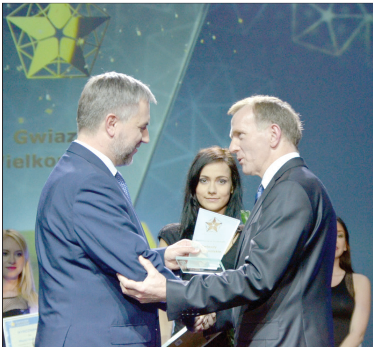
Starosta Kościański odbiera wyróżnienie z rąk Marszałka Województwa Wielkopolskiego.