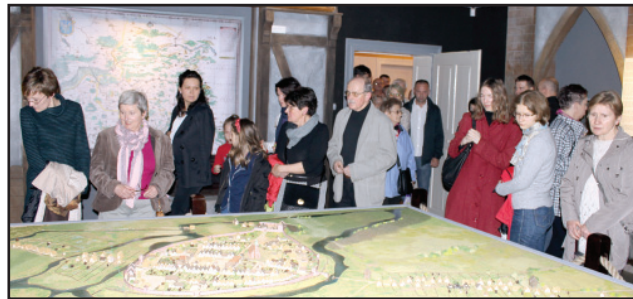
Podczas III Kościańskiej Nocy Muzeów po raz pierwszy zaprezentowano „Dioramę miasta Kościana z XVII wieku”

W sobotę 17 maja br. muzeum zorganizowało III Kościańską Noc Muzeów. W ten szczególnie dzień Muzeum Regionalne im. dr. Henryka Florkowskiego odwiedziło ponad 270 osób. Noc Muzeów była okazją do zaprezentowania nowej wystawy „Królewskie Miasto Kościan” w specjalnie przygotowanej sali ekspozycyjnej. Największą atrakcją okazała się „Diorama miasta Kościana z XVII wieku”. Na makiecie przedstawiono historyczne centrum starego miasta w obrębie murów miejskich i Obry oraz przedmieścia. Znajduje się na niej ponad 200 obiektów m.in. kościoły, zamek starościński, klasztory, domy mieszkalne i zabudowa gospodarcza. Diorama ma przybliżyć mieszkańcom Kościana jak przed wiekami wyglądało miasto. Ponadto dla odwiedzających dostępne były pozostałe ekspozycje oraz wystawa pt.: „2. Korpus Polski we Włoszech i kościańscy żołnierze generała Andersa”. Wyświetlany był również film przedstawiający wojenne losy zabytków zgromadzonych m.in. przez rodzinę Czartoryskich w Gołuchowie. Wszystkich, którym nie udało się obejrzeć wystaw zapraszamy w ciągu tygodnia oraz w weekendy w godzinach pracy muzeum. Wstęp wolny.