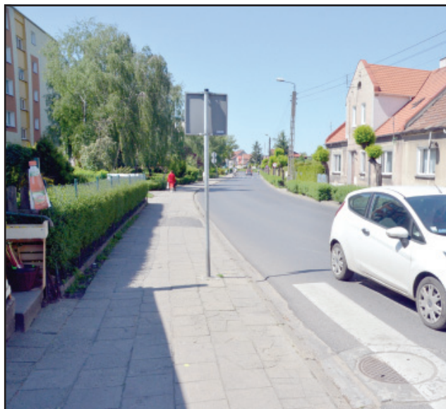
Nowy chodnik będzie na ulicy Piaskowej.

Rozpoczęły się prace remontowe na ulicach Wielichowskiej i Szkolnej w Kościanie. Ulica Szkolna zostanie przebudowana na półkilometrowym odcinku od skrzyżowania z ulicą 27 Stycznia do skrzyżowania z ulicą Północną. Oprócz nowej nawierzchni, na całej długości modernizowanego odcinka, wyremontowane zostaną też chodniki oraz miejsca parkingowe. Ponadto na skrzyżowaniu Szkolnej z Północną wybudowany zostanie tzw. prawoskręt. Koszt przebudowy tej ulicy to 573 591 złotych, kwotą 286 tys. złotych inwestycję wesprze samorząd miasta.