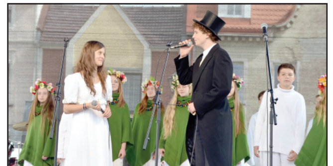
Występ zespołu Semplicze z Lubinia.