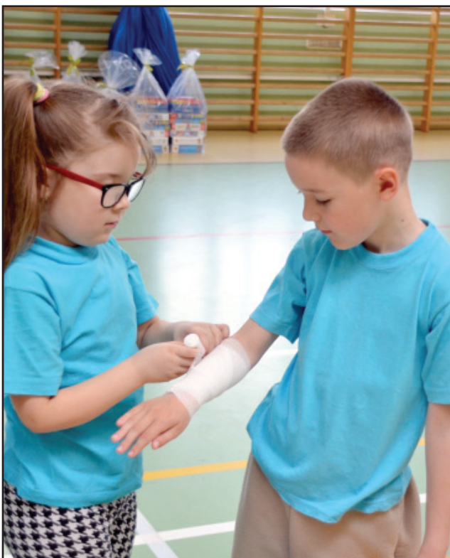
Quiz obejmował zagadnienia z pierwszej pomocy.

Nagrody rzeczowe, w postaci gier planszowych, puzzli i układanek, dostała każda drużyna. hg