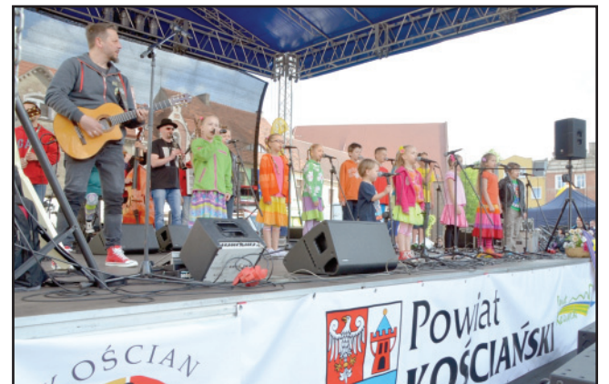
Gwiazdą popołudnia był zespół Arka Noego.

Oprócz koncertów na rynku na kościaniaków czekały także inne atrakcje. Najmłodszy mogli za darmo skorzystać ze zjeżdżalni pneumatycznej Klaun, wspiąć się na dmuchaną górę wspinaczkową w kształcie żółwia, czy pozanurzać się w suchym basenie wypełnionym piłeczkami. Nieco starszych wolontariusze z Zespołu Szkół Ponadgimnazjalnych w Nietążkowie zachęcali do zarejestrowania się w bazie potencjalnych dawców szpiku kostnego. Na głodnych nie tylko wrażeń muzycznych, czekało stoisko, gdzie można było kupić bigos i kiełbasę oraz stoisko wystawione przez firmę Top Farms Wielkopolska Sp. z o.o. z Piotrowa Pierwszego, producenta naturalnie tłoczonych soków Sogo. Na stoisku można było spróbować oraz kupić wszystkie rodzaje soków jabłkowych. hg