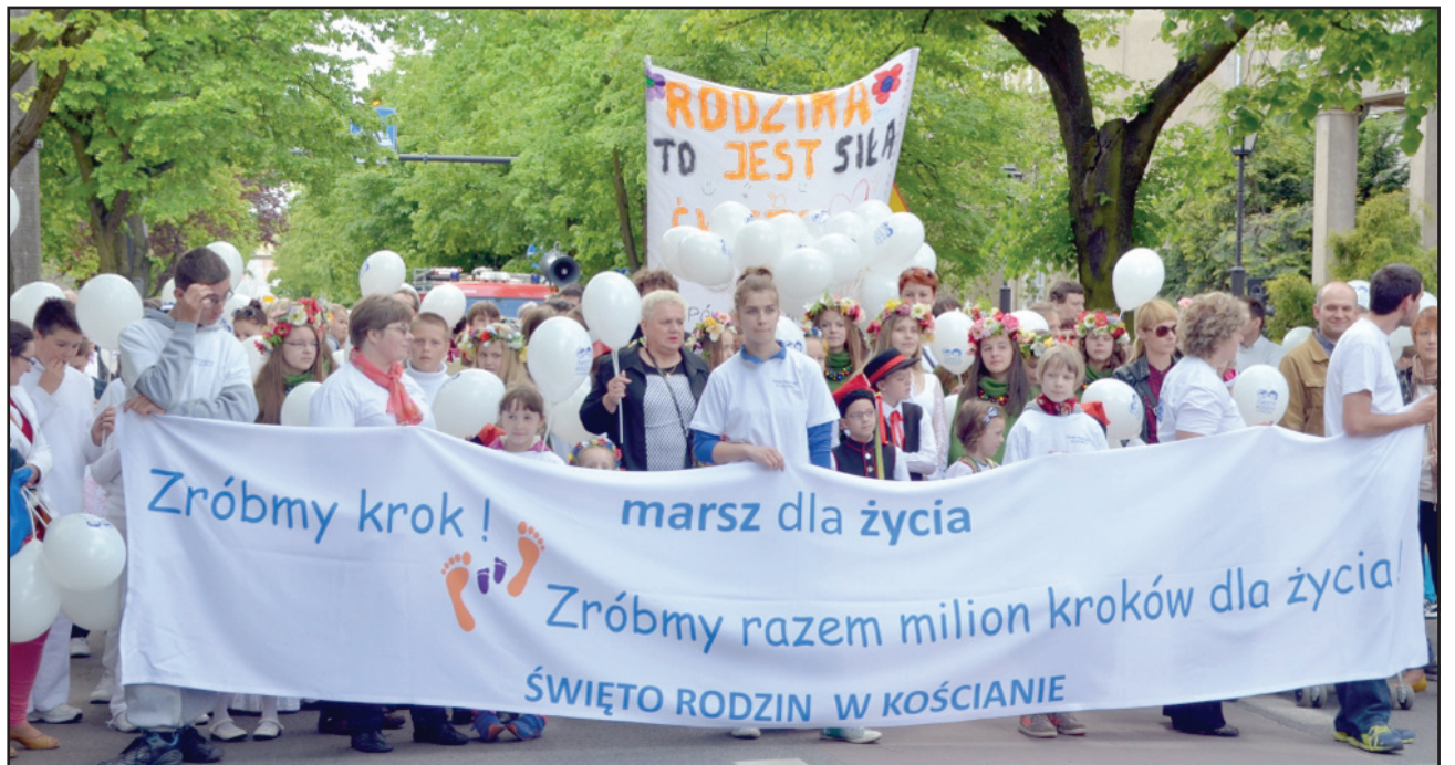
W Święcie Rodzin wzięło udział prawie tysiąc osób.