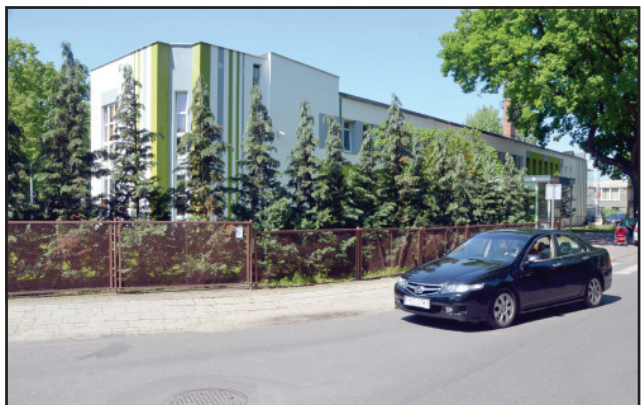
Powiat wesprze przebudowę otoczenia i chodnika w sąsiedztwie Ośrodka Rehabilitacyjnego przy ul. Bączkowskiego.