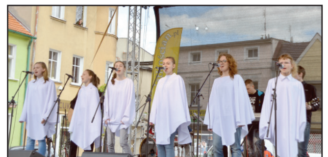
Zespół Bliżej Nieba ze Śmigła.