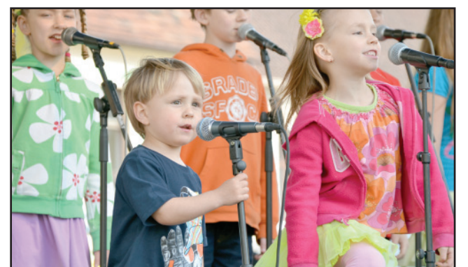
Najmłodszy wokalista Arki Noego nie ukończył jeszcze trzech lat.