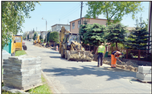
Ulica Szkolna będzie miała nową nawierzchnię.