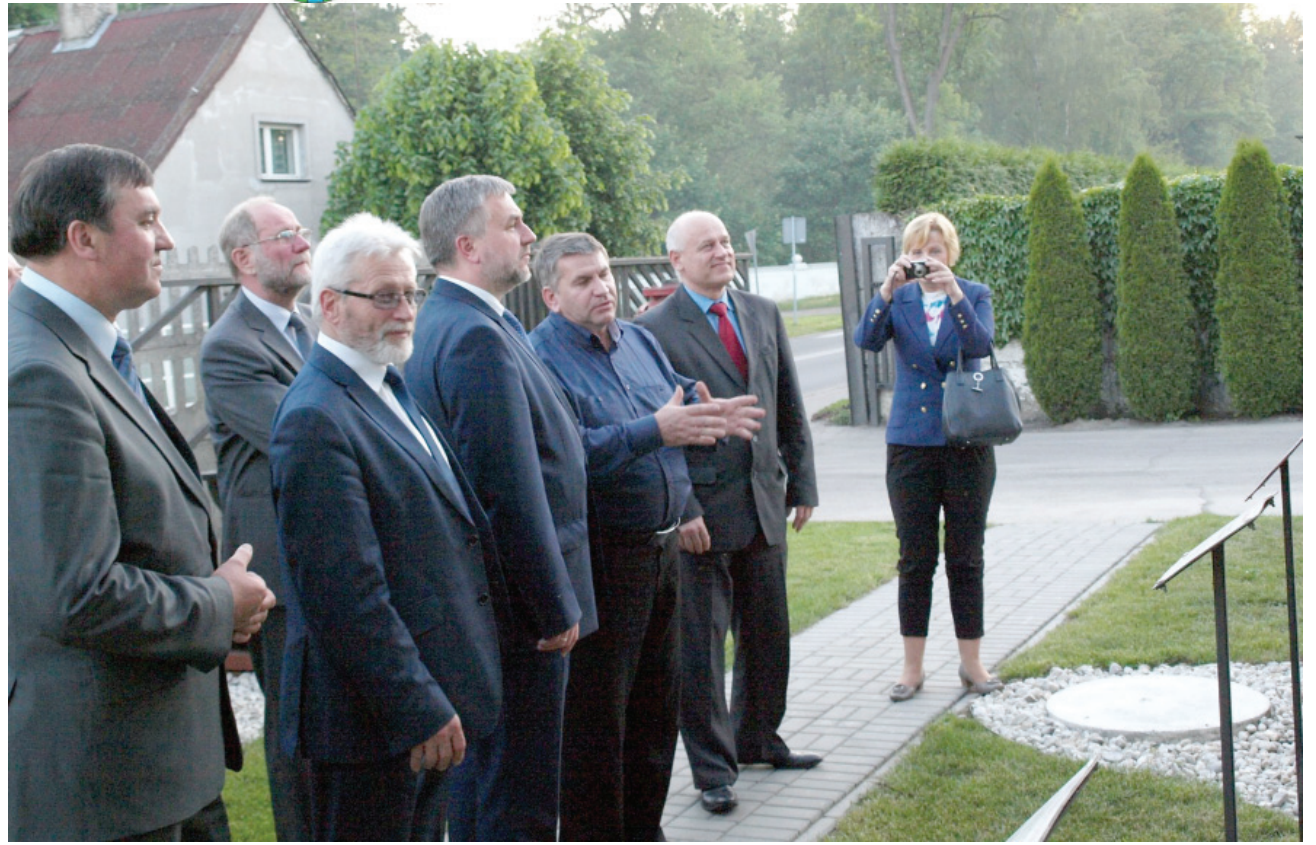
Wizyta Marszałka w Muzeum Gorzelnictwa w Turwi