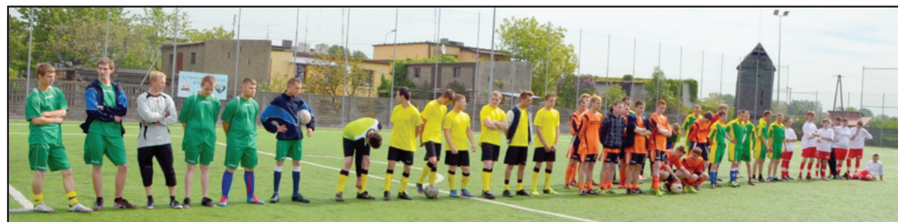
W Mistrzostwach Wielkopolski w Pilce Nożnej Szkolnictwa Specjalnego wzięło udział 5 drużyn.

Wyniki poszczególnych meczów: REGION PILSKI - REGION KONIŃSKI 6:0 REGION KALISKI - REGION LESZCZYŃSKI 0:2 REGION KONIŃSKI - REGION POZNAŃSKI 0:4 REGION PILSKI - REGION KALISKI 4:0 REGION LESZCZYŃSKI - REGION POZNAŃSKI 2:0 REGION KALISKI - REGION KONIŃSKI 1:1 REGION LESZCZYŃSKI - REGION PILSKI 2:1 REGION POZNAŃSKI - REGION KALISKI 2:2 REGION KONIŃSKI - REGION LESZCZYŃSKI 0:7 REGION POZNAŃSKI - REGION PILSKI 1:5