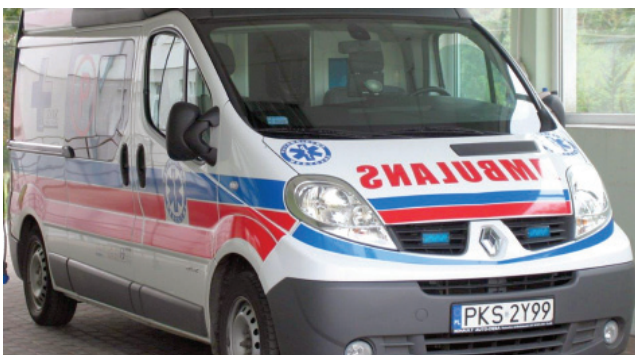
Od 1 stycznia 2015 roku w Krzywiniu stacjonować się karetka typu P.

Starania władz Powiatu o zmianę miejsca stacjonowania Zespołu Ratownictwa Medycznego typu P z Kościana do Krzywina obejmowały liczne pisma kierowane zarówno do Wojewody Wielkopolskiego, jak i do Ministra Zdrowia. Kilkuletnie apele na rzecz utworzenia dodatkowego miejsca stacjonowania karetki typu P w Krzywiniu, obejmowały również zebranie list z 4432 podpisami mieszkańców miasta i gminy Krzywiń, których kserokopie pismem z dnia 9 grudnia 2011 r. Starosta Kościański przekazał Ministrowi Zdrowia. W kolejnych latach, w pismach wielokrotnie wskazywano na zagrożenie życia i zdrowia mieszkańców miasta i gminy Krzywiń w wyniku m.in. powtarzających się przypadków przekroczenia ustawowo określonego czasu dotarcia ZRM na miejsce zdarzenia. ad