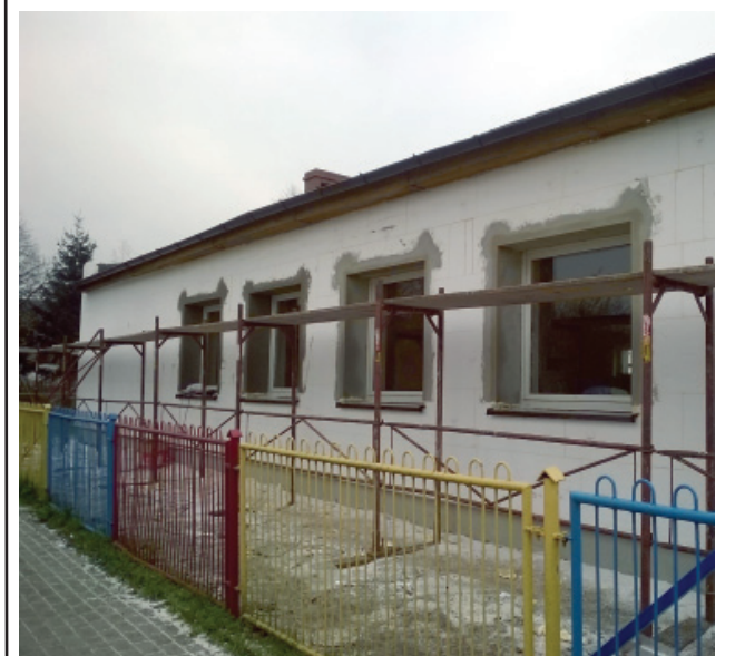
W trakcie prac termomodernizacyjnych

Zakończyły się prace termomodernizacyjne budynku świetlicy wiejskiej w Darnowie. Remont budynku rozpoczęty w październiku br. obejmował docieplenie ścian zewnętrznych styropianem, izolację ścian fundamentowych budynku, wymianę sufitu podwieszanego wraz z wymianą oświetlenia sali głównej, docieplenie dachu za pomocą wełny mineralnej miękkiej ułożonej na nowym suficie podwieszanym, wymianę stolarki drzwiowej zewnętrznej, naprawę zarysowanej ściany w kuchni oraz wykonanie nowych utwardzeń z kostki betonowej wokół świetlicy. Wykonawcą prac termomodernizacyjnych oraz remontowych była Firma Budowlana Szymon Wajnert z Olszy za kwotę 103.904,02 zł brutto. (asz-k)