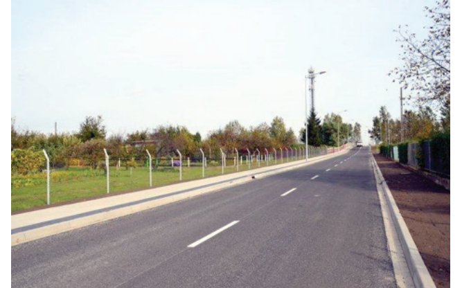
Powiat uzyskał dofinansowanie z WRPO za przebudowę ulicy Łąkowej z 2012 roku.