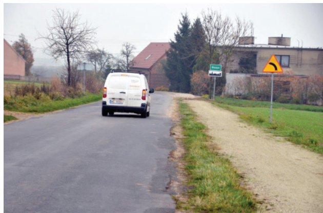
Wniosek na przebudowę drogi Lubiń-Mościszki otrzymał gwarancję dofinansowania już w październiku.