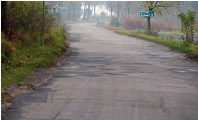
Przebudowa drogi Widziszewo-Gniewowo obejmować będzie m.in. poszerzenie drogi i położenie nowej nawierzchni bitumicznej.

Wcześniej gwarancję uzyskania dofinansowania ze środków NPPDL w wysokości 1.775.144 zł otrzymał wniosek na przebudowę drogi Lubiń-Mościszki. hg