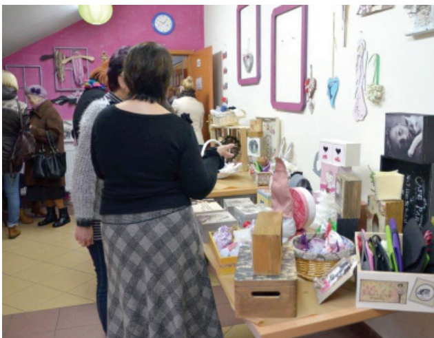
Na wystawie można było podziwiać m.in. ozdoby świąteczne i pudełka na biżuterię wykonane w stylu decoupage.

Świąteczną atmosferę budował zespół, składający się z uczniów i nauczycieli Zespołu Szkół Specjalnych ubranych w stroje mikołajów. Podczas wystawy goście byli częstowani smakołykami przygotowanymi przez gospodarzy. hg