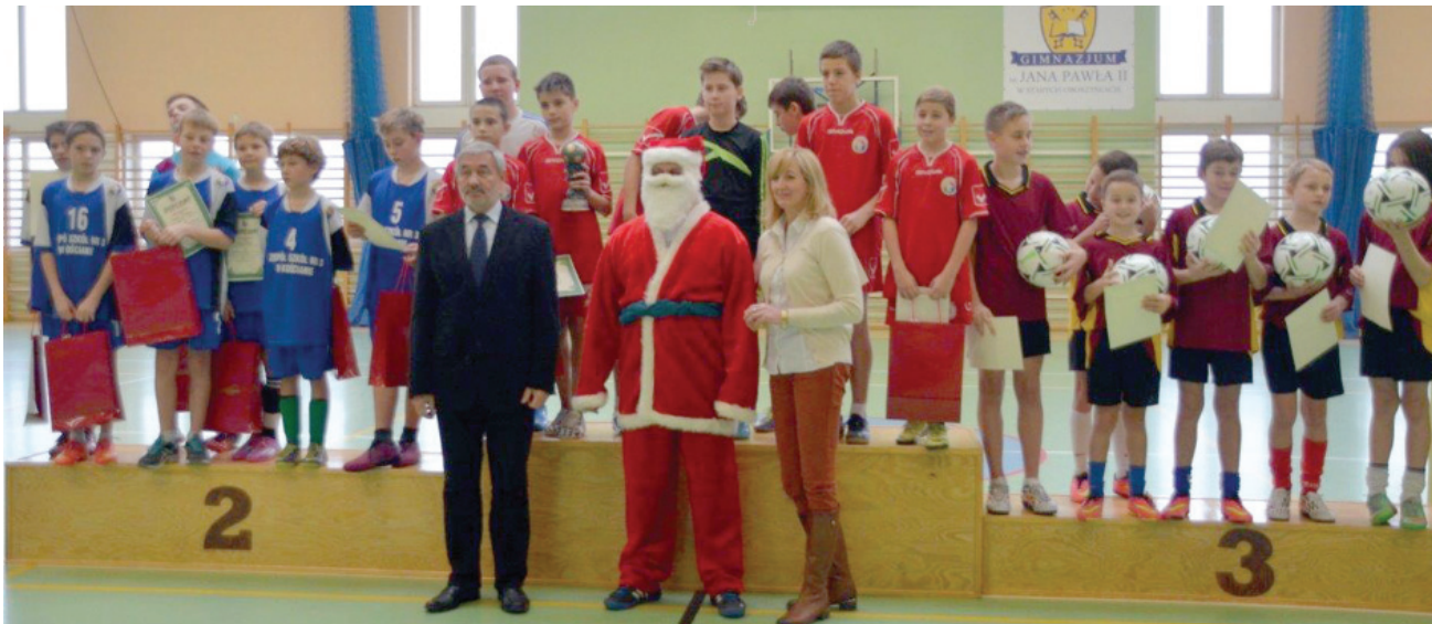
Po raz pierwszy w historii Turnieju zwycięzcy z poprzedniego roku udało się obronić tytuł.