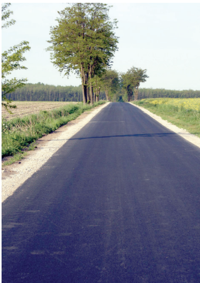
Droga Nowy Dębiec - Osiek