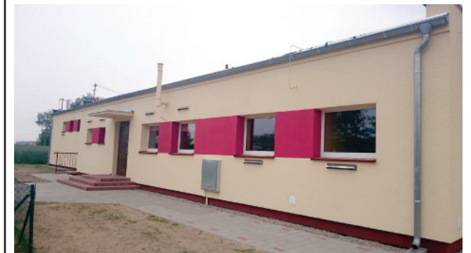
Zmodernizowany budynek świetlicy wiejskiej w Łagiewnikach