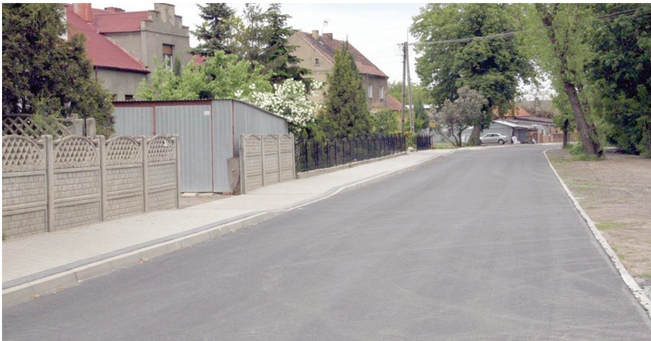
Ulica Lipowa w Widziszewie